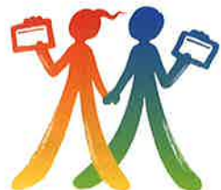
(公財)安全衛生技術試験協会