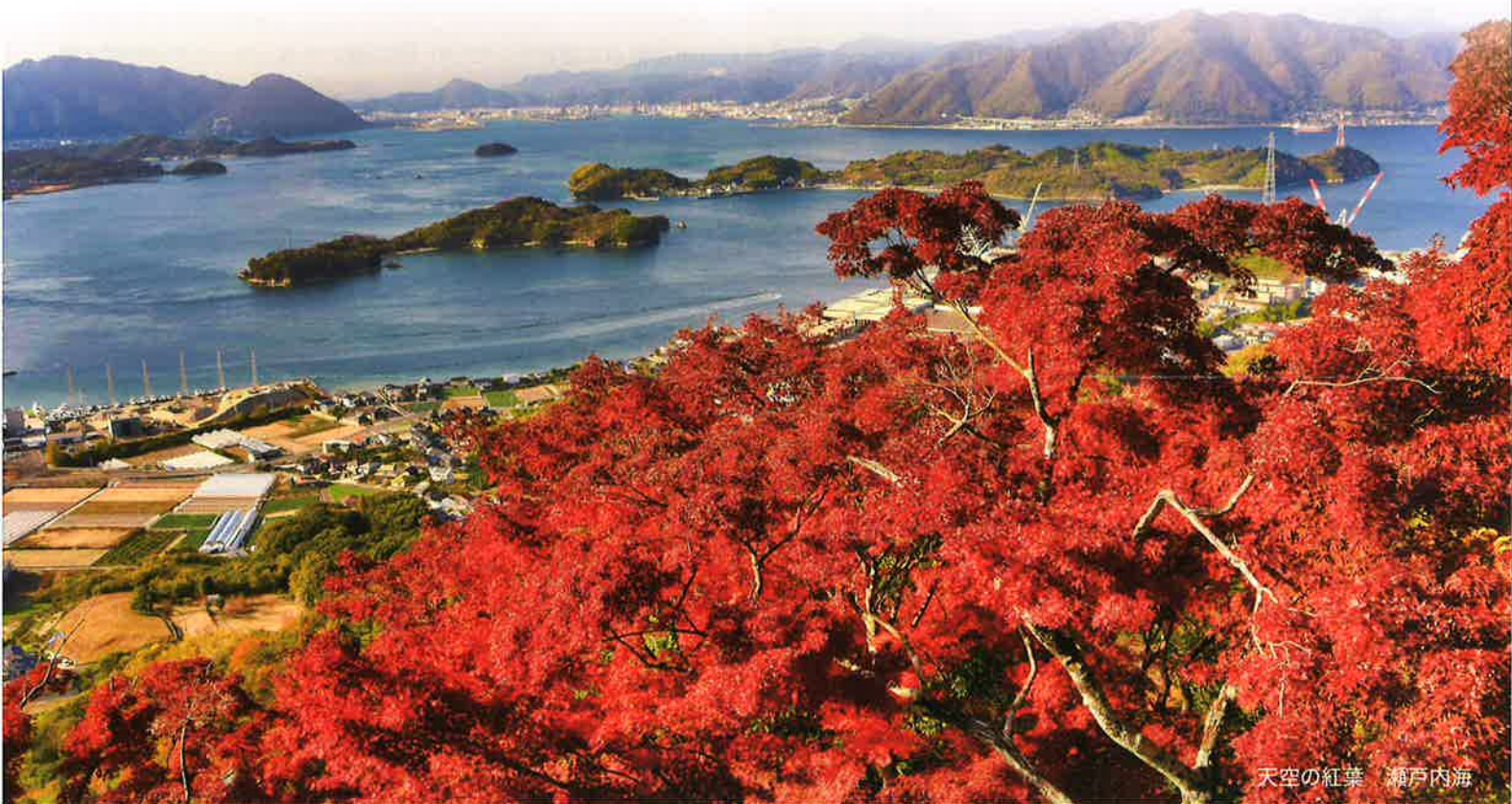
天空の紅葉 瀬戸内海