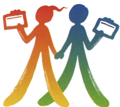
(公財)安全衛生技術試験協会