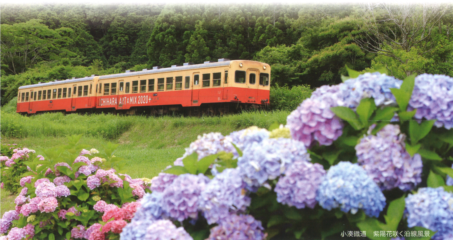
小湊鐵道 紫陽花咲く沿線風景