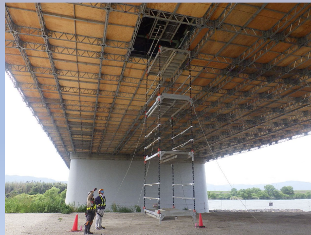
スーパースタッド吊上げ