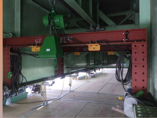
吊り架台・電チェーン設置