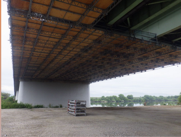
スーパースタッド搬入