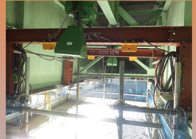
吊り足場開口・手摺設置